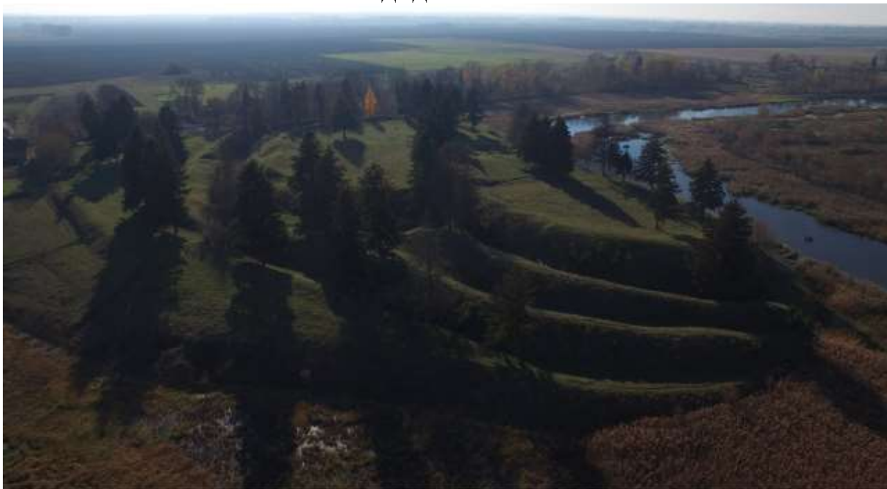
Рис. 1. Вид укріплень Губинського городища з північної сторони. Аерофотозйомка 1 листопада 2015 р.