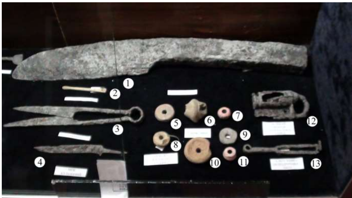
Рис. 2. Комплекс знахідок із північного укріплення Губинського городища: 1 - чересло; 2 - вухочистка; 3 - ножиці; 4 - ніж; 5 -11: прясла прясел; 12 - замок; 13 - ключ