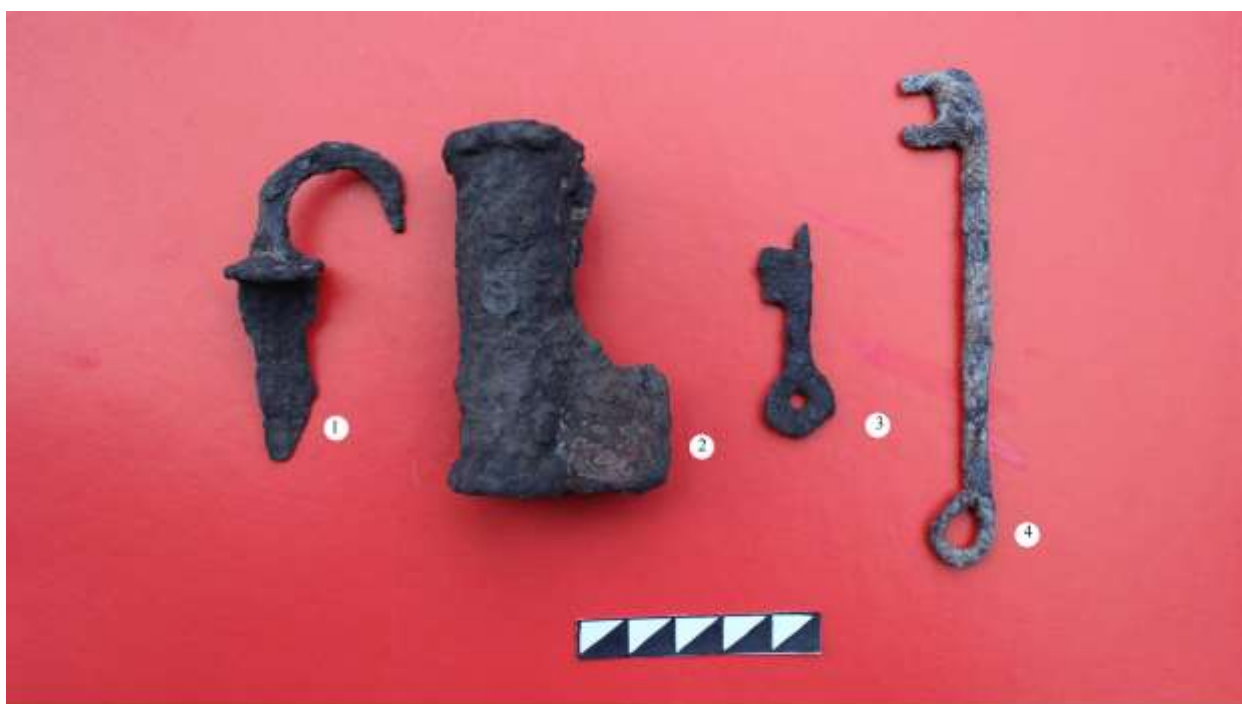
Рис.2б. Знахідки з площі розкопу території Південного укріплення Губинського городища: 1 - елемент замка; 2 - циліндричний корпус замка; 3,4 - Ключі до замків. Дослідження 2014 року.