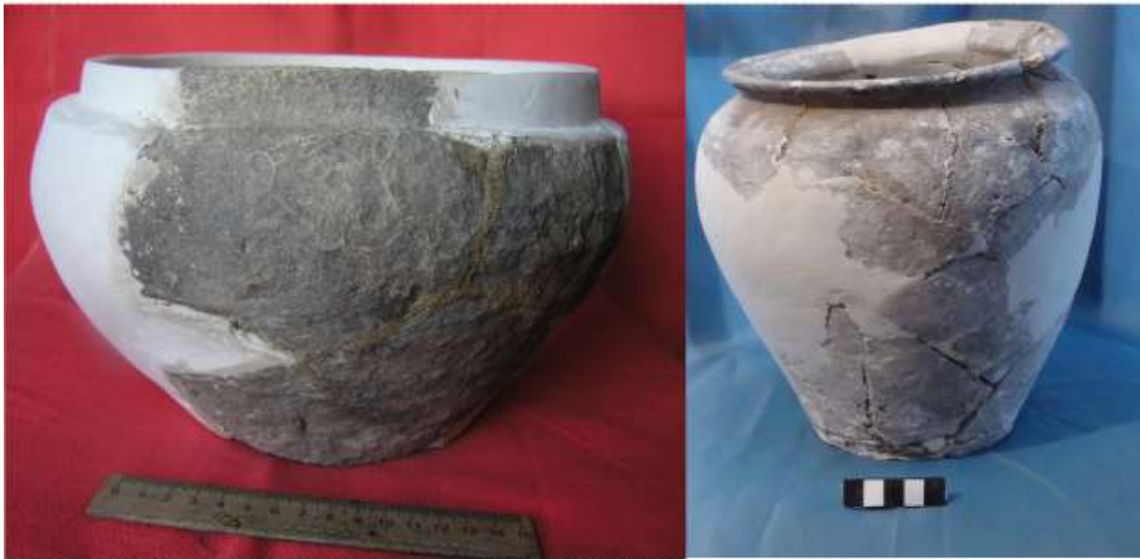
Рис. 3. Кружальна посуда (реставрована) XII - XIII ст. з розкопок Губинського городища.