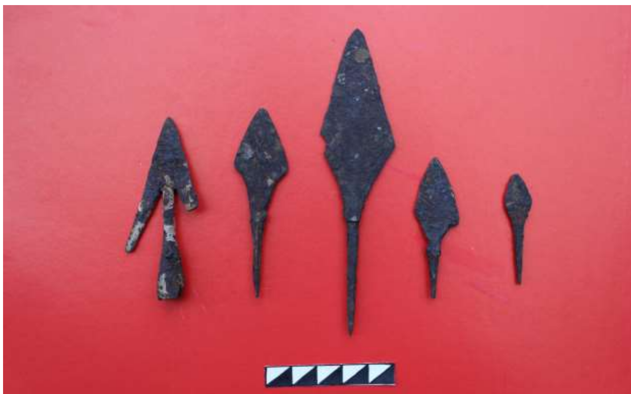
Рис. 2 а. Комплект наконечників стріл з площі розкопу на території Південного укріплення Губинського городища. Дослідження 2014 року.